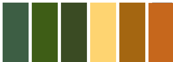
459 AA S1 Oxide of Chromium Oxyde de Chrome 503 A S2 Permanent Sap Green Vert de Vesse Permanent 447 B S1 Olive Green Vert Olive 422 A S1 I Naples Yellow Hue Nuance de Jaune de Naples 744 AA S1 I Ochre Jaune Ocra Jaune 552 AA S1 I Raw Sienna Terre de Sienna Naturelle