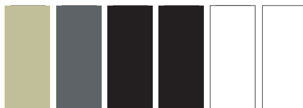
217 A S1 Davy's Gray Gris de Davy 465 A S1 I Payne's Gray Gris de Payne 331 AA S1 I Ivory Black Noir d'Ivoire 337 AA S1 I Lamp Black Noir De Fumée 415 AA S1 I Soft Mising White Blanc pour Mélanges 644 AA S1 I Titanium White Blanc de Titane