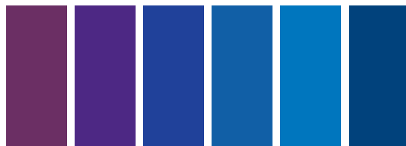
194 A S1 I Cobalt Violet Hue Nuance de Violet de Cobalt 229 A S1 I Dioxazine Purple Violet Dioxazine 263 A (iii) S1 I French Ultramarine Outremier Français 667 A (ii) S1 I Ultramarine (Green Shade) Outremier (Nuance Verte) 179 A S1 I Cobalt Blue Hue Nuance de Bleu de Cobalt 538 A S1 I Prussian Blue Terre de Prusse